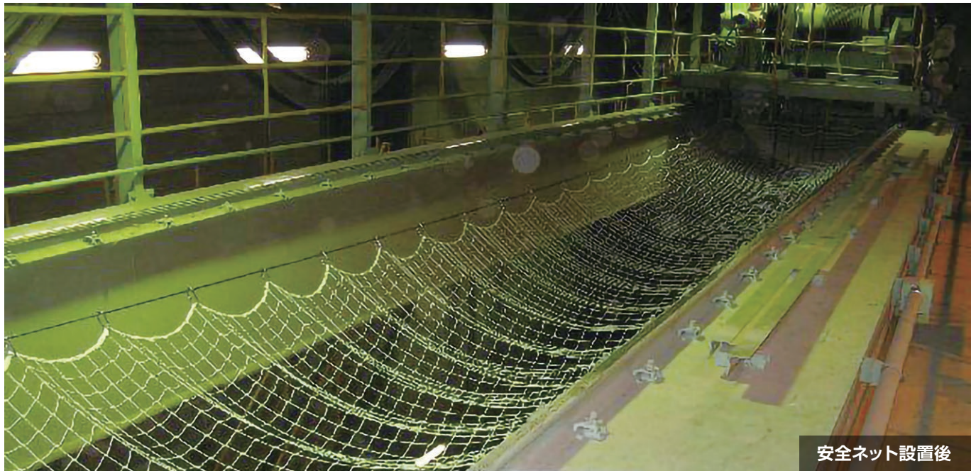
安全ネット設置後

クレーンのガーダ間に安全ネットを設置することで人がクレーン上から転落するリスクを低減します。 安全ネットはクレーンの横行動作に伴って伸縮するので、トロリの移動を妨げることはありません。